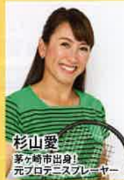
杉山愛 茅ヶ崎市出身! 元プロテニスプレイヤー