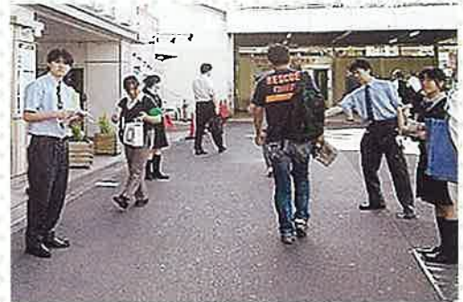
保土ヶ谷駅前での「痴漢防止キャンペーン」