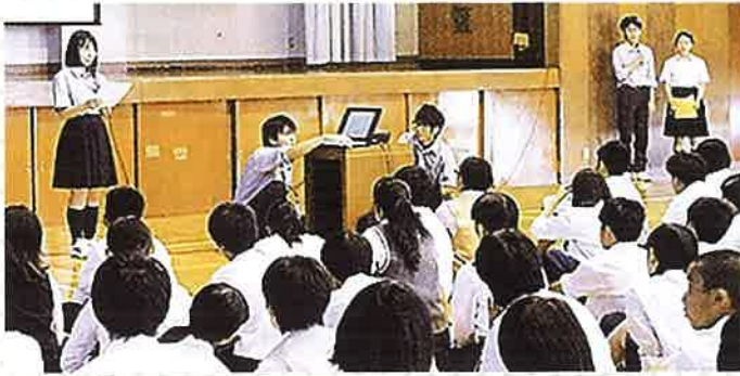
横浜市立橋中学校3年生向けの非行防止教室「#君に届け!!～最後の中学校生活」