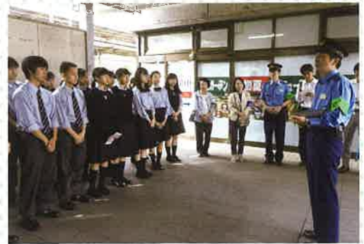
保土ヶ谷駅前での「痴漢防止キャンペーン」団結式

「セーフティかながわユースカレッジ」では、インターアクトクラブがこれまで実践してきた防犯活動を発表するとともに、県内外の学生・生徒と学びを深めました。次回の防犯キャンペーンをどう行っていくべきかということのアイデアを得て、地元の方々の協力を密にし、保土ヶ谷から世界へ発信し続けていきます。